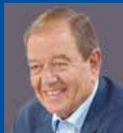
Patrick OLLIER Ancien Ministre, Président de la Métropole du Grand Paris, Maire de Rueil-Malmaison